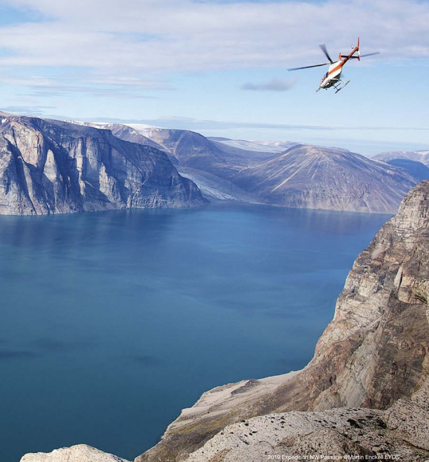
2019 Expedition NW Passage

le valigie. E, dall'alba al tramonto, il personale esperto e competente che conosce le preferenze personali degli ospiti è a loro completa disposizione. Ogni giorno si esce dal proprio appartamento galleggiante per andare incontro ad una nuova avventura.